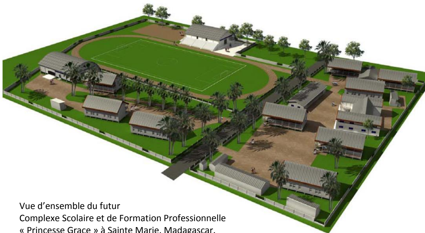
Vue d'ensemble du futur Complexe Scolaire et de Formation Professionnelle « Princesse Grace » à Sainte Marie, Madagascar.

Fin 2009, la première tranche (qui comprend le préscolaire, la maternelle et le primaire jusqu'à la 5ème) est achevée et les élèves y reçoivent l'enseignement depuis la rentrée d'octobre 2009.