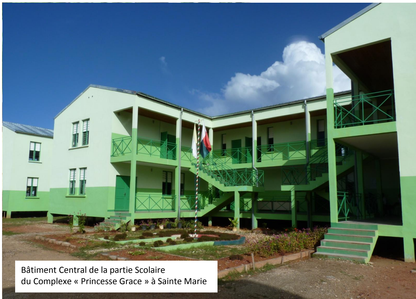
Bâtiment Central de la partie Scolaire du Complexe « Princesse Grace » à Sainte Marie

Le gouvernement monégasque a été un acteur indispensable à la réussite de cette opération, par l'intervention directe du Prince Souverain , de notre Ambassadeur et le support de la Direction de la Coopération Internationale .